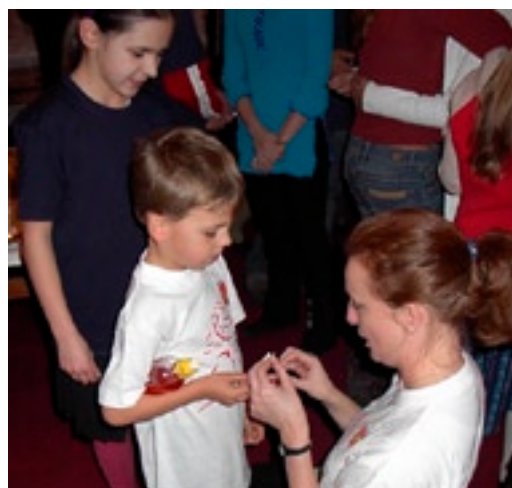
ZPiT "Nowa Ruda"