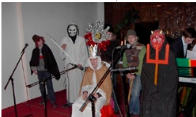
Wigilia w sekcji muzycznej