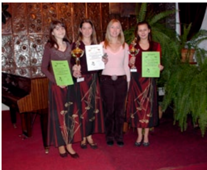
Szekcja Poezji Śpiewanej