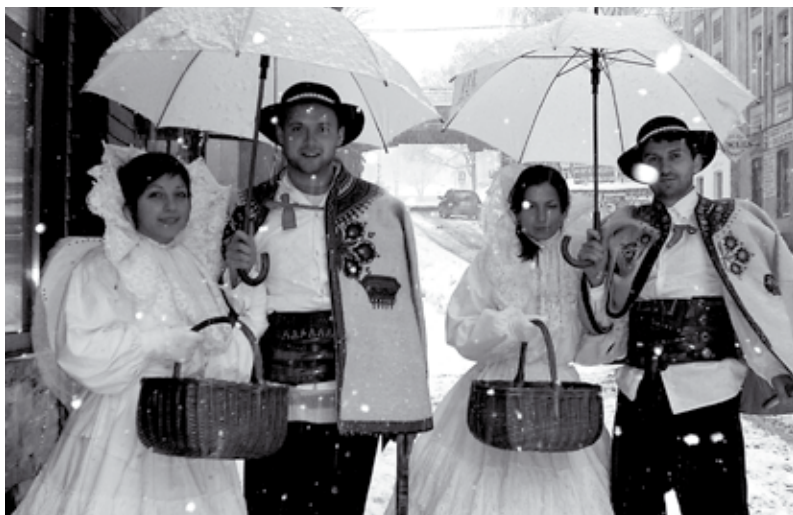
Z mieszkańcami Nowej Rudy opłatkiem i życzeniami dzielili się pracownicy MOK-u