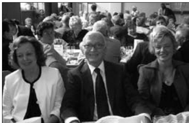
„Repas des Ainés” – każdego roku mer Wallers wydaje uroczysty obiad dla wszystkich osób, które ukończyły 65 rok życia. W tym roku zaproszono ok. 270 osób. Wspólny posiłek jest okazją do wspomnień, rozmów i wspaniałej zabawy przy muzyce.