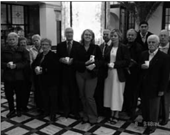
Polanica Zdrój – Francuzi mieli okazję zwiedzić nasze sąsiednie uzdrowisko i skosztować „Staropolanki”