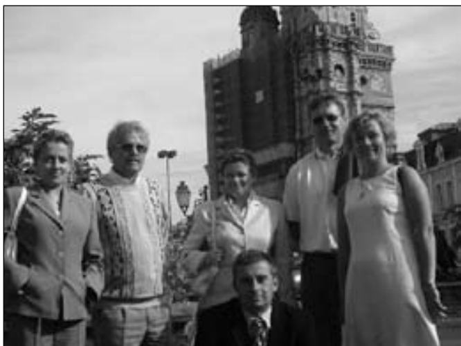
Wizyta w Saint Amand les Eaux, znanym uzdrowisku północnej Francji. W tle 82-metrowa, obecnie restaurowana, wieża opactwa z VII w. Wewnątrz znajduje się Muzeum Ceramiki, z wyrobów której miasto słynęło aż do XVIII w.