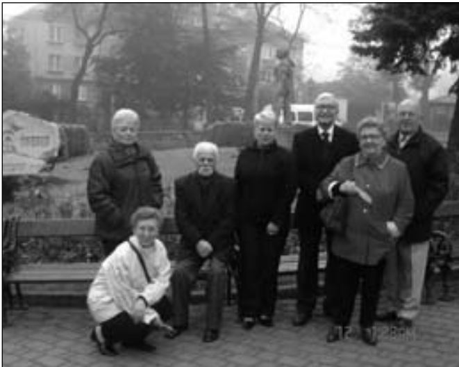
Kraków – tradycją stała się już wizyta w Krakowie oraz w Wieliczce; w tym roku jednak podczas dwudniowej wycieczki zaplanowane również zwiedzanie Państwowego Muzeum Auschwitz-Birkenau w Oświęcimiu