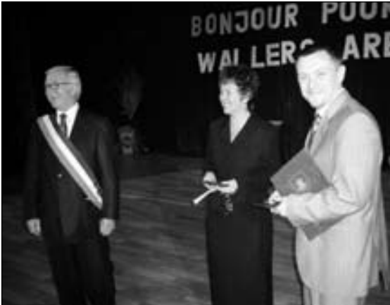
Obchody X-lecia podpisania partnerstwa między Nową Rudą a Wallers-Arenberg odbyły się na Sali Widowiskowej Miejskiego Ośrodka Kultury w Nowej Rudzie.