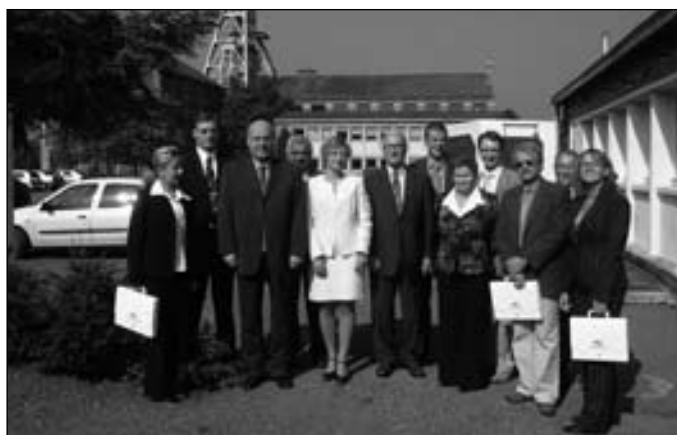
Spotkanie z przedstawicielami Aglomeracji La Porte du Hainaut – instytucji zarządzającej parkami przemysłowymi znajdującymi się w okręgu Valenciennes. W tle budynki byłej kopalni w Arenberg, w których obecnie mieści się siedziba aglomeracji.