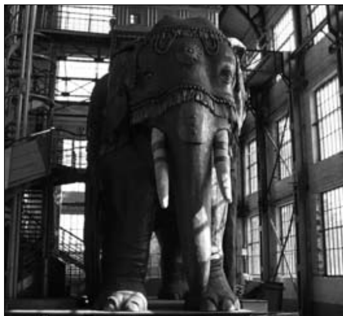
Słoń pamięci – powstał w 1989 roku w departamencie Nord z okazji obchodów dwusetnej rocznicy rewolucji francuskiej i do 1992 roku „podróżował” po różnych miastach północnej Francji i Belgii. Obecnie słoń znajduje się w byłym budynku należącym do kopalni w Arenberg.