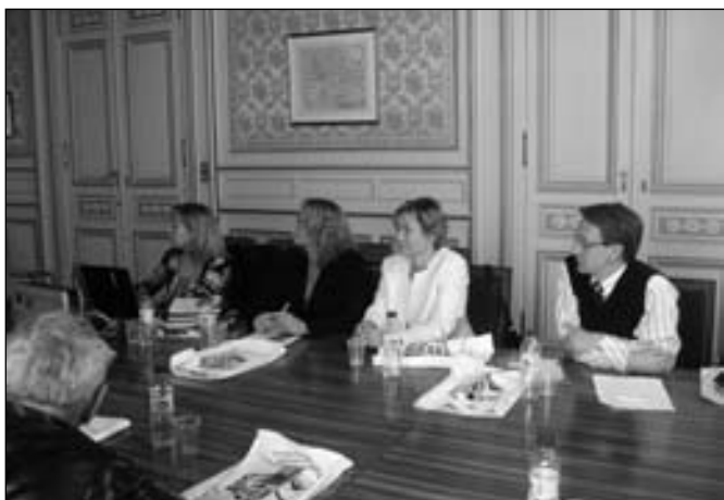
Spotkanie w Izbie Przemysłowo-Handlowej w Valenciennes – izby we Francji są doskonałym źródłem informacji o sposobach prowadzenia działalności gospodarczej na tamtejszych rynkach. Oferują kompleksowe usługi, od wpisu do rejestru gospodarczego do doradztwa strategicznego.