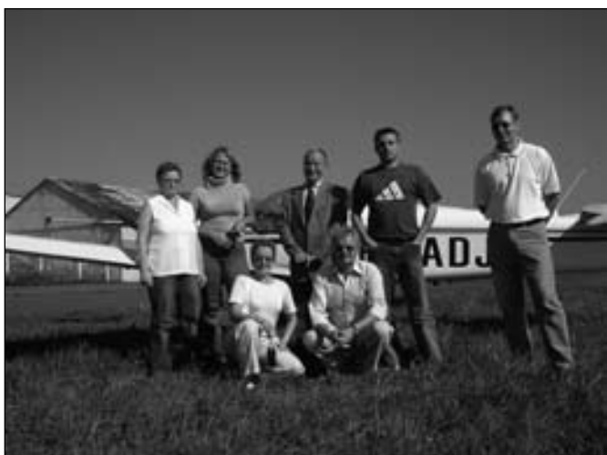
„Aérodrome de l'Ouest”- najwięcej wrażeń dostarczyło oglądanie parków przemysłowych z „lotu ptaka” zorganizowane przez właściciela Szkółki pilotażu przy lotnisku pocztowym w pobliżu Valenciennes.