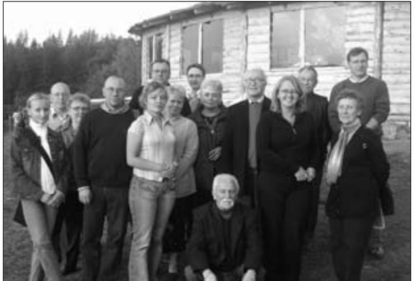
„Hubertus Ziemi Kłodzkiej 2005”- z niezwykle uroczego miejsca, w jakim odbyły się w tym roku obchody dnia św. Huberta goście podziwiali roztaczające się widoki Nowej Rudy i okolic. Żałowali jedynie, że zwycięzca „Pogoni za lisem” okazał się zbyt szybki ...