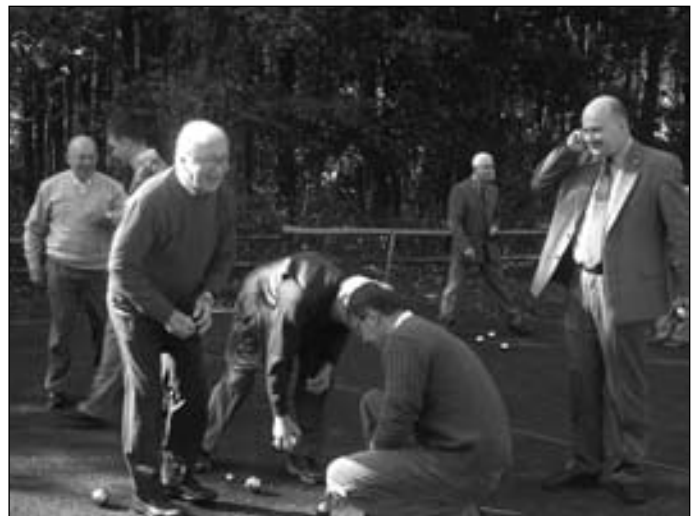
Leśniczówka w Bożkowie – zwiedzanie ścieżki dydaktycznej „Bagnisty Las” połączono z rozegranie turnieju gry w „boules”.