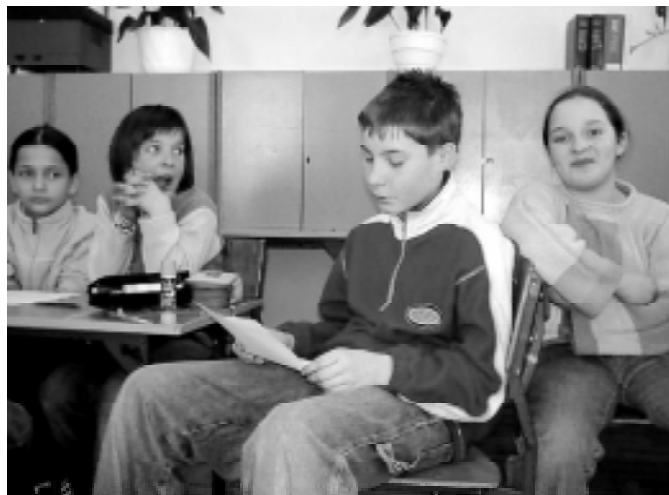
Młodzi redaktorzy w grupach formułowali wnioski na piśmie, a później prezentowali je na forum warsztatów.