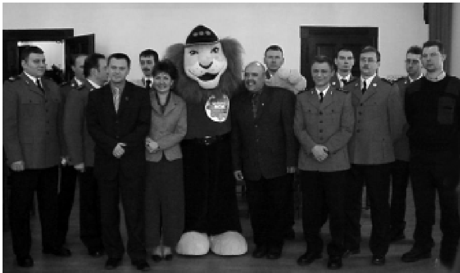
Noworudzki Komisarz Lew pozował do zdjęć w towarzystwie władz i policjantów.

Rudy i okolic - wręcz przeciwnie. Jak pokazały praktyka i spotkania, w których na Ziemi Noworudzkiej wzięło udział w 2004 r. ponad 6 tys. dzieci, Komisarz Lew jest magnesem skupiającym zainteresowanie dzieci do spraw bezpieczeństwa i utrzymania porządku w naszym najbliższym otoczeniu. (Iwi)