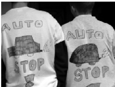
O Dniu bez Samochodu czytaj str. 5.