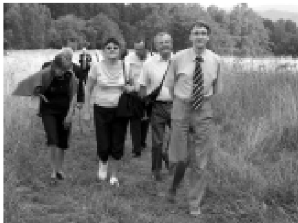
Fot. W drodze na Górę Wszystkich Świętych.