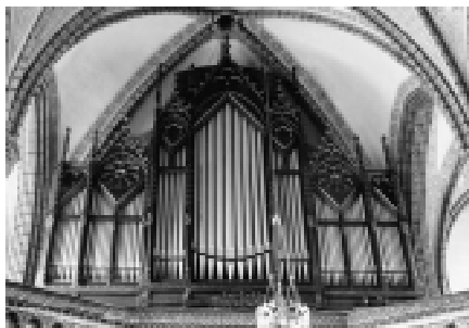
Fot. Organy w Kościele Św. Mikołaja.

w Nowej Rudzie poprzez pomoc ze strony Wydziału Promocji i Rozwoju Miasta w złożeniu wniosku o dofinansowanie na przykład ze środków unijnych. W późniejszym etapie, w oparciu o wypracowany wniosek, na etapie sporządzania projektu budżetu na rok 2005 Komisja Gospodarcza wypracuje kwotę środków na dofinansowanie renowacji organów.