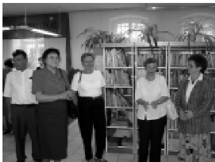
Fot. Spotkanie w Miejskiej Bibliotece Publicznej.

Goście odbyli także wycieczkę objazdową po Ziemi Kłodzkiej (Kłodzko, Wambierzyce, Radków, Polanica Zdrój), zwiedzali Muzeum Górnictwa w Nowej Rudzie.