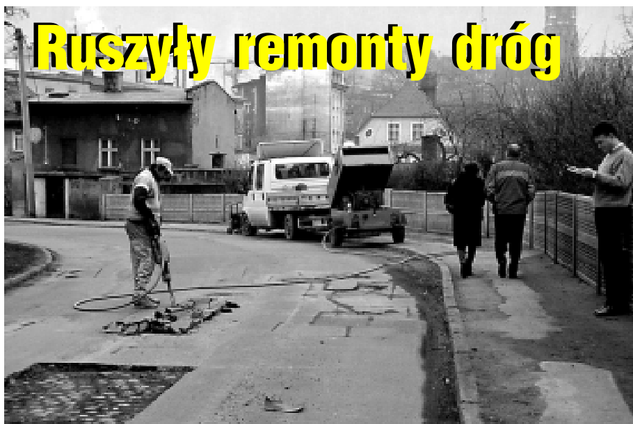
Trwa „łatanie dziur” na ul. Piłsudskiego prowadzącej do Rynku. W pierwszej kolejności przeprowadzono już naprawę nawierzchni ulic Szytygarskiej i Kombatantów w Słupcu oraz ul. Boh. Getta i Matej w centrum miasta. fot. Wojciech Grzybowski

Jak się dowiedzieliśmy - po kolejnej interwencji władz Nowej Rudy w Zarządzie Dróg Wojewódzkich - już niebawem rozpocznie się „łatanie dziur” na drodze wojewódzkiej Nr 381 Wałbrzych - Kłodzko przebiegającej przez miasto. (Iwi)