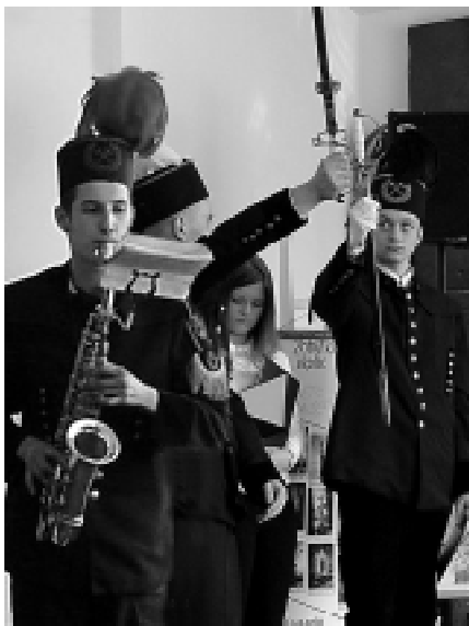
Hitem ubiegłorocznej uroczystości „Adopcji zabytków” w Miejskim srodku Kultury była prezentacja uczniów Noworudzkiej Szkoły Technicznej.

Uczniowie pod opieką nauczycieli dokonali już wyboru zabytków (w przypadku trzech szkół, które przystąpiły do tego programu w bieżącym roku szkolnym)