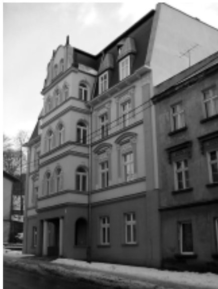
Odremontowany po pożarze budynek przy ulicy Przechodniej jest jednym z ładniejszych w Nowej Rudzie.